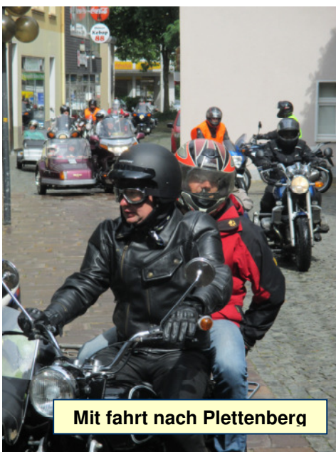
Mit fahrt nach Plettenberg